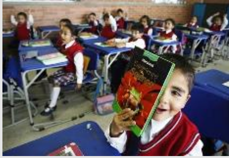
Alumnos del colegio distrital Débora Arango Pérez

Por mi parte he sostenido desde entonces que el problema no radica en el modelo de administración, sino en la capacidad o incapacidad del Estado para ofrecer educación de buena calidad.