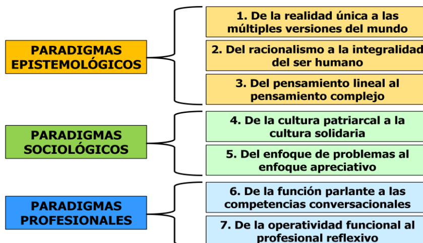
Gráfico No. 5. Nuevos paradigmas para la formación de los docentes

Los programas de formación inicial y continua de los docentes han incorporado un saber propicio acerca del qué, el cómo, el para qué y el querer hacer de la profesión. Sin embargo, el avance en lo relacionado con las capacidades internas de los docentes, el con qué – referido a su ontología, al tipo de ser humano que son, a la cosmovisión, al profundo sentido de la vida, a las creencias orientadoras, a los paradigmas de fondo- presenta diferentes vacíos, tal como empíricamente puede constatararse al observar los resultados de la formación en este campo específico. Abordar la ampliación complementaria de las capacidades de los docentes en los programas de formación de sus competencias profesionales, implica al menos trabajar en los siguientes paradigmas, que integralmente pueden aportar a una cosmovisión que haga posible el diseño de ambientes de escolares pertinentes para potenciar la disposición de los estudiantes hacia los aprendizajes. Tres son de orden epistemológico, dos son del orden sociológico y dos del ejercicio profesional.