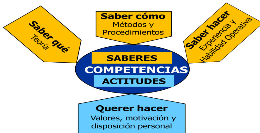
Gráfico No. 2. Ámbitos de las competencias laborales

En efecto, para desarrollar capacidades de los docentes para la generación de ambientes escolares formadores en ciudadanía, se hace imprescindible que desarrollen capacidades no solamente en saber qué enseñar (saber disciplinar), saber cómo hacerlo (saber didáctico) y querer hacerlo (motivación), sino también y fundamentalmente en su condición ontológica, es decir en su ser, en los paradigmas, meta relatos o creencias básicas desde los cuales asignan sentido de la vida, de modo que interiormente tengan con qué acometer su función transformadora en los procesos formativos con sus estudiantes, por cuanto si su cosmovisión está asentada en los viejos paradigmas patriarcales, espontánea e inconscientemente sus prácticas estarán estructuradas desde los mismos, y les será muy difícil, si no imposible, estructurar ambientes de aprendizaje alternativos a los tradicionales, centrados en la obediencia, la disciplina y el miedo. En este sentido, la triada de la formación profesional de los docentes debe estar constituida por los siguientes elementos.