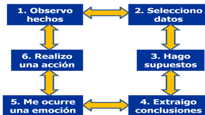
Gráfico No. 1. Escalera de inferencias de la operación del observador

Ello se explica por el hecho de que todas las personas operamos en nuestra cotidianidad como observadores del entorno y de nosotros mismos, y lo que hacemos depende del tipo de observador que somos. Nos relacionamos con los demás y con el mundo sobre la base de una operación inconsciente que nos lleva a establecer juicios y conclusiones y a disponernos emocionalmente respecto a aquello que observamos, sin detenernos a pensar en la validez de los datos o interpretaciones (Senge y otros, 2002). En la siguiente gráfica se ilustra el modelo de esta operación, denominada escalera de inferencias: