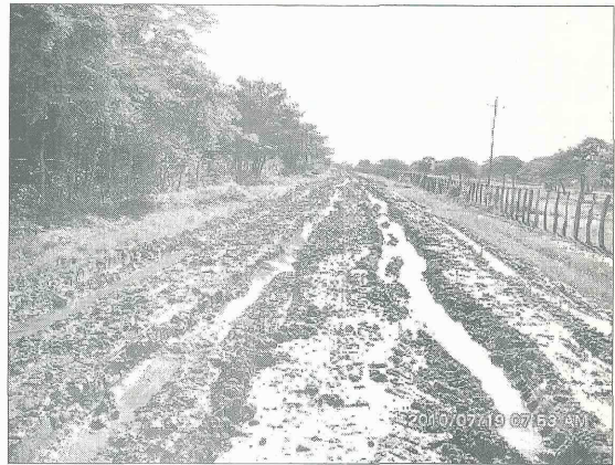
Para las vías terciarias, se asignaron 1.500 millones de pesos por parte del Instituto Nacional de Vías y 300 millones del Comité de Cafeteros.

El titular del despacho departamental de Infraestructura, dijo que la distribución de los recursos se está haciendo de la forma más transparente y que para los 1.500 millones de pesos para la red terciaria,