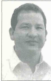
Omar Díazgranados, gobernador del Magdalena.

De los 3 mil millones 1.500 millones serán para vías primarias y los otros 1.500 más una contrapartida de 300 millones del Comité de Cafeteros serán para vías terciarias.