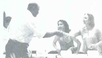
32 Miembros de las Juntas de Acción Comunal fueron graduados hoy tras culminar el Diplomado de Formación de Conciliadores organizado por la Cámara de Comercio de Cartagena

A partir de este proceso pedagógico sobre participación