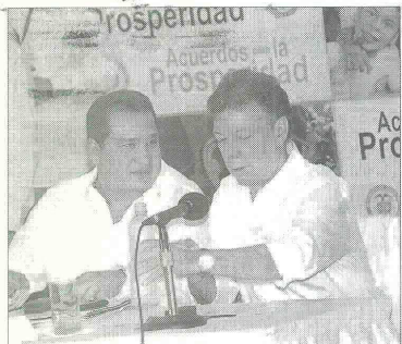
El Magdalena está desarrollando el programa Magdalena Digital en once municipios y la Administración espera que al finalizar el próximo año se esté ejecutando en 28 más.