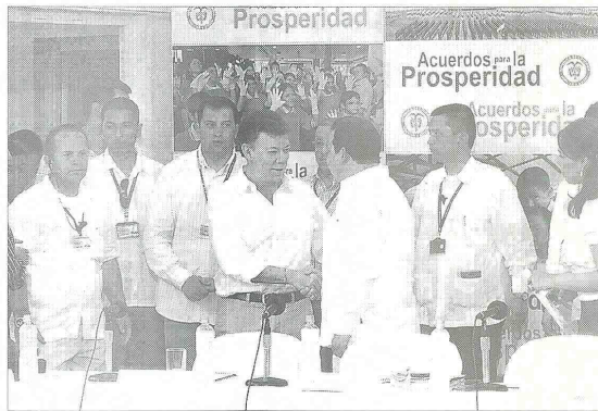
El presidente Juan Manuel Santos, dijo que el Magdalena está por debajo del promedio nacional

En el grado noveno, en lenguaje, el 87 por ciento sacó mínimo e insuficiente y solamente el 13 por ciento satisfactorio; en matemáticas el 95 por ciento mínimo e insuficiente y sólo el 5 por ciento satisfactorio; en ciencias naturales, el 90 por ciento obtuvo mínimo e insuficiente y el 9 por ciento satisfactorio, o sea, que aquí hay que hacer un gran esfuerzo en el Magdalena y el país, porque desafortunadamente en Colom-