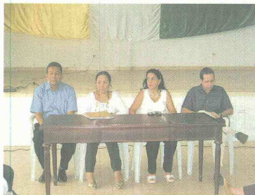
Los coordinadores de las mesas del plan decenal se comprometieron a guiar y movilizar al municipio de Sabanalarga para lograr la formulación de esta iniciativa.

La Secretaría de Educación Departamental del Atlántico, la Fundación Promigas y la Alcaldía Municipal de Sabanalarga, en respuesta al interés compartido por apoyar el mejoramiento de la calidad de la educación, celebraron el lanzamiento del proyecto Gestión Integral de la Educación, para el fortalecimiento de la educación del municipio y la formulación del Plan Decenal de la Educación.