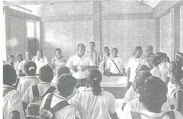
Imbilí (Carretera): Construcción de laboratorio para las aéreas de química y física.

Hacer de Tumaco la más educada del Pacífico es un propósito que no debe terminar en este gobierno, es una estrategia que necesita de grandes gestiones, es por eso que el alcalde quiere garantizarle a la comunidad una estabilidad en el componente más importante para el desarrollo de un pueblo: la educación. Para ello se ha comprometido a construir el Plan Decenal de Educación para Tumaco como política pública para la educación del municipio, proceso certificado que independiente de los gobiernos que continúan, deben dar cumplimiento a estos parámetros.