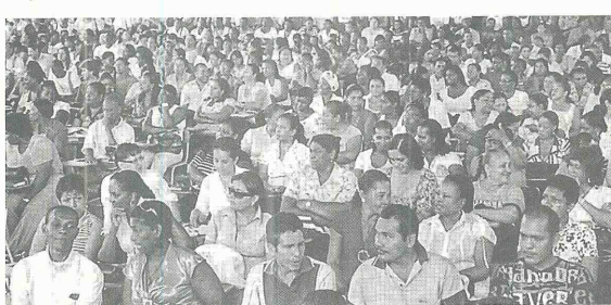
Plan de Formación Docente en el Coliseo de la I.E. Misional Santa Teresita.