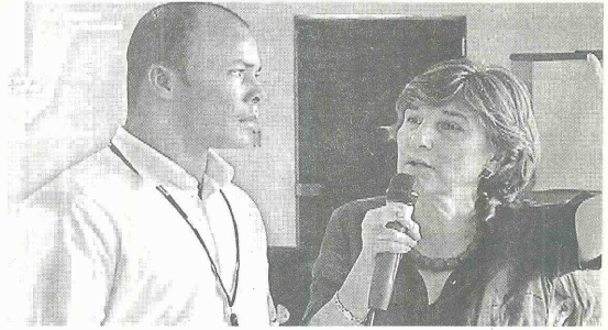
La ministra de Educación Cecilia María Vélez White y el alcalde de Tumaco Neftalí Correa Díaz analizan en el Consejo de Rectores la problemática a la educación de la región.

Se brindó acompañamiento al 100% de los rectores y directivos docentes en la gestión directiva. En el transcurso mes a