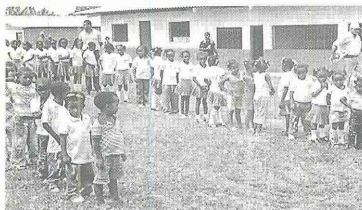
Piñuela (Río Mira): Construcción del aula de sistemas y mejoramiento del restaurante escolar.