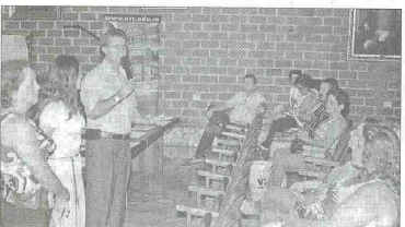
LA UNIVERSIDAD Cooperativa de Colombia con sede en Neiva firmó un convenio interinstitucional con 27 presidentes de Juntas de Acción Comunal de la ciudad.

En el evento, que tuvo como sede la universidad, los líderes comunitarios manifestaron su total complacencia con la realización de este convenio que les permitirá llegar con más seguridad a la Administración Municipal y otras organizaciones a gestionar los diferentes proyectos de inversión para sus localidades.