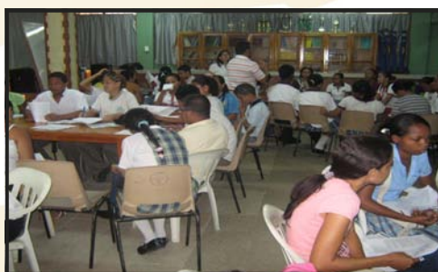
Reunión Plan Decenal—Secretaría de Educación del Distrito de Barranquilla 2010.