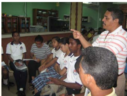
Reunión Plan Decenal—Secretaría de Educación del Distrito de Barranquilla 2010.

Lo importante de las unidades desconcentradas como lo está viendo el ministerio es desde el punto de vista administrativo, pero únicamente no puede ser esto, lo importante es fortalecer los procesos pedagógicos y educativos en esas unidades, porque es en ellas donde se va a operacionalizar el servicio educativo a través de las instituciones que hacen parte de esas unidades desconcentradas.