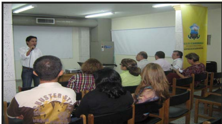
Reunión Plan Decenal—Secretaría de Educación distrito de Barranquilla 2010.