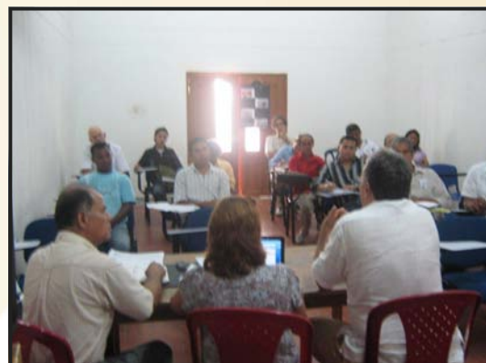
Reunión Plan Decenal—Secretaría de Educación del Distrito de Barranquilla 2010.

en el sistema. Hay que reconocer que la Secretaría de educación pasada hicieron esfuerzos importantes en la modernización de la secretaria de educación, la reformó, la sistematizó, porque los gremios, hicieron un gran compromiso con la secretaria de educación, "el compromiso de los empresarios por la educación:... Nosotros hemos dado continuidad, para garantizar los avances. A nivel nacional el ministerio reconoció el proceso como destacado.