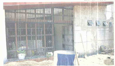
El área del inmueble es de 300 metros cuadrados. La propietaria no dejó entrar a los funcionarios de Control Urbano.

Los negocios o establecimientos que vayan a ser construidos