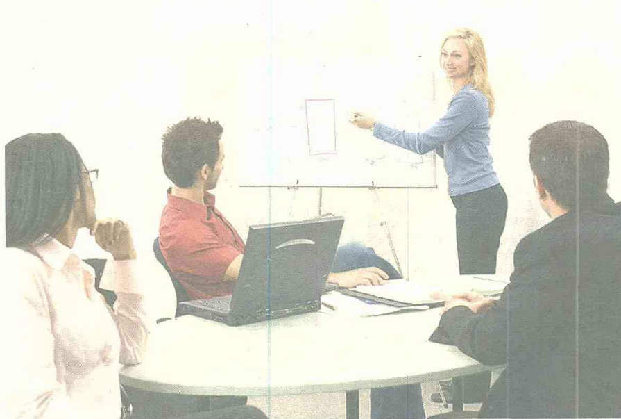
Aumentar la matrícula en la educación técnica profesional y tecnológica es uno de los propósitos del Plan Decenal.

Para la ministra de Educación Nacional, Cecilia María Vélez, hay que mejorar la cobertura, calidad y pertinencia de la formación técnica profesional y tecnológica, hacerla más acorde con las necesidades del sector