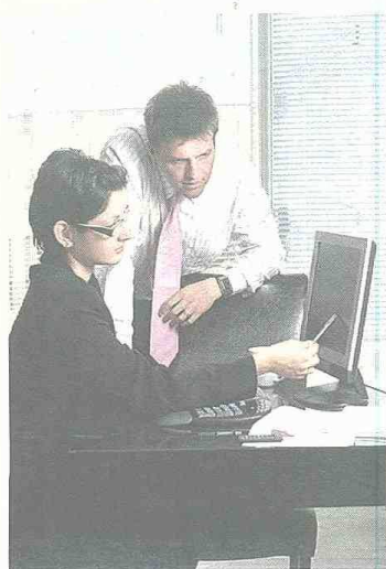
El Observatorio es un instrumento valioso para mejorar la pertinencia educativa.

Una de las estrategias para eliminar las barreras a la competitividad consiste en articular la academia con las necesidades de los sectores productivos estratégicos para el país.