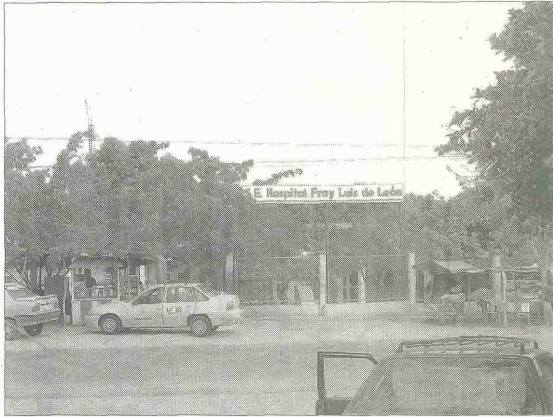
Al igual que la mayoría de los hospitales del Departamento, el Fray Luis de Plato se debate en una grave crisis.

De acuerdo con el concepto de la funcionaria, el Hospital presta servicios de mediana complejidad, y se encarga de realizar todas aquellas patologías, pero acorta tiempo en el procedimiento del régimen contributivo, que debe ser bajo autorización de las empresas a la cual se les presta el servicio. Dijo que el otro factor es la población vinculada o pobre, no asegurada, que lo paga el Departamento en una sola bolsa, donde le llega el dinero y a través de Planeación Nacional, determina cual es el dinero que le deben girar al departamento del Magdalena. "Piensa que todos estos hospitales de segundo nivel tienen dificultades, ya que por problemas en las autorizaciones no han podido facturar. Por eso el Gobierno nacional, a raíz de la expedi-