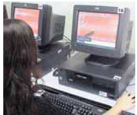
En Antioquia hay un computador por cada 19 estudiantes.

a la universidad a la adultez donde los jóvenes tienen mayor riesgo de adquirir o incrementar la adicción y en muchos casos se inicia en encuentros de amigos.