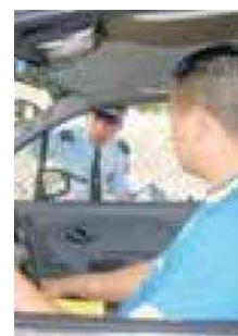
Habrá rotación del Pico y Placa.

● A partir del lunes próximo habrá cambios importantes en un par de medidas reglamentarias de movilidad en Medellín.