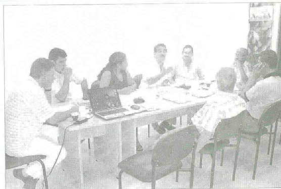
Los directivos y miembros de la Asociación de Bananeros de Colombia se declararon satisfechos por los logros de Augura el año anterior en favor del gremio.

En seis años que lleva el programa, se ha hecho una inversión total de 1.013 millones de pesos, con el objetivo desarrollar prácticas productivas sostenibles en la agroindustria bananera, a través de un proceso de gestión y desempeño