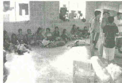
Todas las instituciones involucradas tienen la obligación de garantizar los derechos de esta población.

Articulación Una de las mayores debilidades encontradas dentro del proceso de ayuda a los afectados por el conflicto interno en el país, es la desarticulación interinstitucional, en temas tan neurálgicos como la protección de la vida, la seguridad, integridad y libertad personal de los afectados. En la unificación de bases de datos de la población desplazada, desactuali-