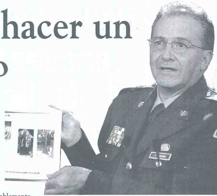
ÓSCAR NARANJO, director de la Policía Nacional.

"Uno de los primeros hallazgos tiene que ver con un plan sobre el cual la columna móvil 'Teófilo Forero' ha insistido a lo largo de los últimos años, un plan que utilizaría básicamente