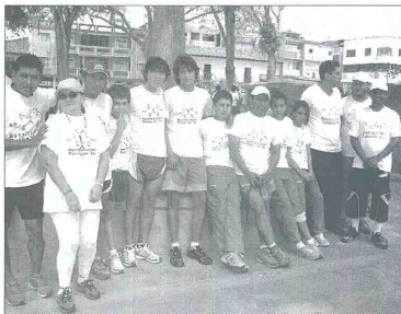
ESTOS SON LOS jóvenes que ayer arribaron a Pitalito y que participan en la Maratón Nacional por la Niñez.

Destacó el apoyo de la comunidad del Putumayo y del Huila que ha ofrecido toda su colaboración por los lugares por donde ha pasado la marcha, permitiendo con ello entregar un mensaje claro a la comunidad sobre los objetivos de esta prueba que se inició en la ciudad de Pereira.