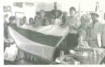
En total, son doce los abuelos que representan al Atlántico en este encuentro nacional.

Magdalena contará con la participación de 550 adultos mayores. En el encuentro se invertirán mil millones de pesos.