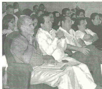
Los mandatarios departamentales y parlamentarios señalaron que estas acciones no permitirán el avance de la Región Caribe.

Indicó que "esta discusión, tenemos que darla entre todos. En este momento tenemos que reunirnos nuevamente con la bancada regional, disminuida por las dificultades del paramilitarismo que ha golpeado muchísimo nuestra representación, y los gobernadores que tendremos que tener unos argumentos muy sólidos para tratar de acceder a mayores recursos del presupuesto nacional". El gobernador de Sucre, Jorge Barzra, subrayó que los recortes no so-