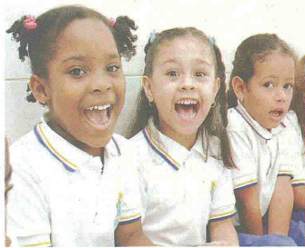
Los niños están felices con sus nuevos salones, lo que sigue la adecuación del parque recreativo que actualmente solo tiene columpios.

UN PREESCOLAR DE la comuna uno goza de un completo paquete de atención integral a la población menos favorecida, que incluye educadora especial, nutricionista y psicóloga. Un ejemplo del trabajo que desde las fundaciones se hace por la primera infancia.