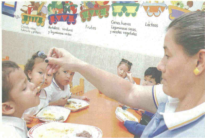
En el preescolar se trabaja con los niños la locomoción, el desarrollo verbal, la creatividad y la motricidad fina. En el año la nutricionista hace tres evaluaciones para saber qué niños pueden estar sufriendo de desnutrición para comenzar a trabajar la condición desde la casa del pequeño.

quien?, ¿cuáles son los hábitos alimenticios de la familia?, son datos que ayudan a detectar condiciones de hacinamiento o pequeños propensos a la desnutrición.