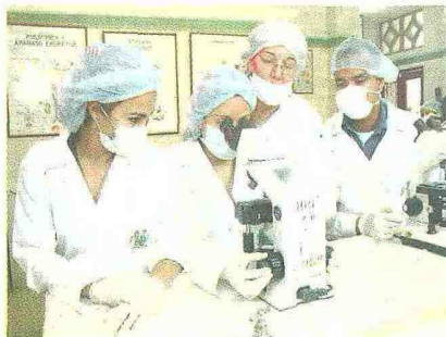
La tecnología e innovación en las aulas es fundamental.