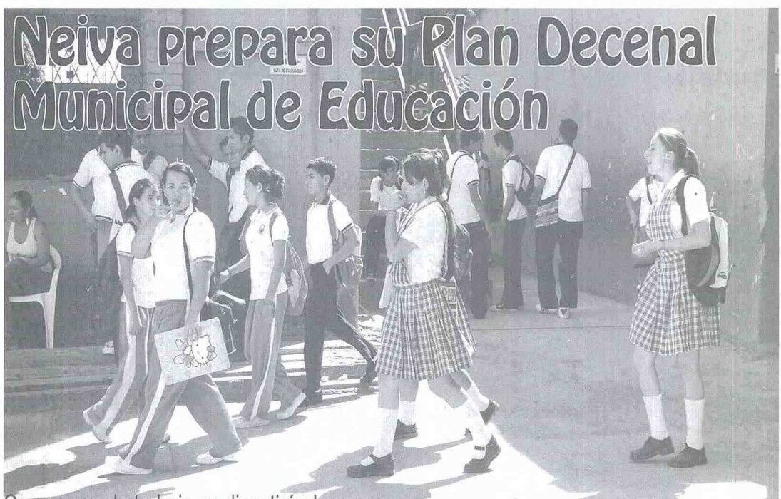
Con mesas de trabajo se discutirá el nuevo norte que tomará la educación de Neiva.

La estrategia de trabajo tendrá a la mano tres plataformas para lo que será la construcción del Plan Decenal de Educación Municipal. Una de ellas tiene que ver con el aspecto virtual, lo cual permitirá que la comu-