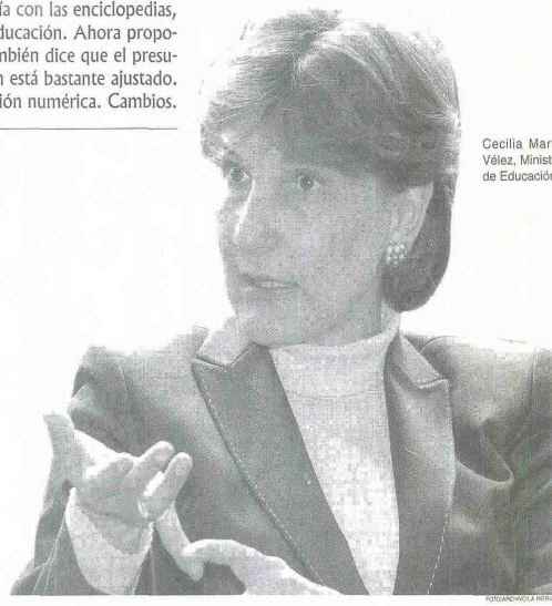
Cecilia María Vélez, Ministra de Educación.

Antes la gente se defendía con las enciclopedias, asegura la Ministra de Educación. Ahora propone otras estrategias. También dice que el presupuesto para la educación está bastante ajustado. Revive la calificación numérica. Cambios.