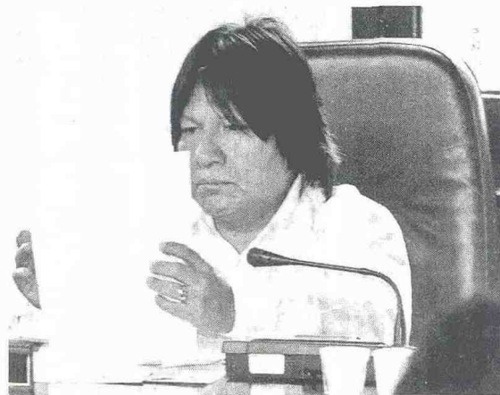
EL PERSONERO de Bogotá, Francisco Rojas Birry, denunció que el reclutamiento forzado por parte de los grupos paramilitares es un riesgo permanente en la ciudad.

El Personero de Bogotá rechazó la violencia paramilitar contra los jóvenes de Ciudad Bolívar y otras localidades. “El reclutamiento forzado por parte de los grupos paramilitares es un riesgo permanente”, agregó.