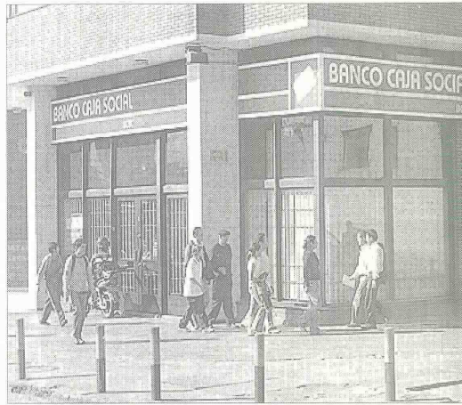
Créditos por 3 billones 931 mil millones de pesos respaldó el Fondo Nacional de Garantías (Fng), entre enero y septiembre de este año

El Fng proyecta garantizar en 2008 créditos por más de 5,5 billones de pesos, beneficiando a más de 200 mil usuarios.