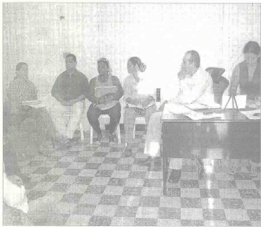
El alcalde ratificó en la reunión del Consejo de Política Social, la implementación de medidas para luchar contra la extrema pobreza en Ciénaga