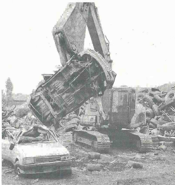
LA SECRETARÍA Distrital de Movilidad, ante supuestas denuncias de corrupción en el proceso de chatarrización, determinó enviarlas a los organismos de control.

Entre tanto, el Mira estableció que en el Decreto 115 de 2.003, que creó el