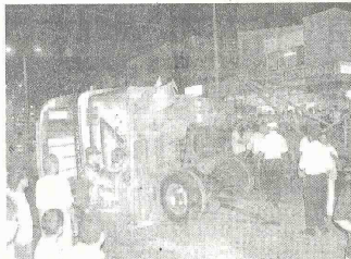
Los automóviles presentan el mayor porcentaje de vehículos involucrados en accidentes, con un 51%, seguido de buses, busetas y micros con un 18%.

Del total de accidentes con víctimas mortales el 52% corresponde a conductores, el 19% a pasajeros y el 29% a peatones.