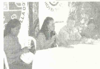
ASPECTO DE LA RUEDA DE PRENSA EN LAS INSTALACIONES DEL ZOOLOGICO.

Las Asartesanas recogen y procesan bolsas plásticas usadas para tejer con ellas hermosos bolsos, con los cuales mejoran sus ingresos, ayudan a limpiar el medio ambiente y tienen una opción de trabajo distinto a la caza y venta de este primate. Para apoyar en esta importante iniciativa, la Fundación Botánica y Zoológica de Barranquilla y la Fundación Proyecto Tití, han diseñado en el marco de la celebración nacional del Día del Tití (15 de agosto), este concurso entre colegios con el propósito de ayudar en la consecución de este insumo indispensable en la elaboración de sus productos. Los colegios interesados en participar en esta importante campaña ambiental, podrán inscribirse en el sitio web: