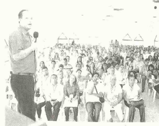
DERROCHE de ingenio en los proyectos y esmerada búsqueda de mejoramiento del aprendizaje, elementos sobresalientes del Foro Departamental de Educación

Teniendo en cuenta la preocupación de miles de colombianos, surgida de las inquietudes del Plan Decenal, sobre la forma como se evalúa en Colombia y de la promoción de estudiantes y el sistema de calificación vigente, se llevó a cabo el Foro departamental de educación en el municipio de Baranoa, en el que la reflexión principal con la comunidad educativa fue consolidar una evaluación atendida en la realidad de nuestra región. Las ponencias presentadas en la Institución educativa La Normal Santa Ana del Municipio de Baranoa, fueron acompañadas de evidencias representadas por estudiantes y docentes, entre las que se destacó la de Carreto, corregimiento del municipio de Candelaria, donde los maestros, por medio de un dramatizado, hicieron la compra de un mercedito educativo llenando la canasta de ingredientes con la integralidad, la flexibilidad y muchos valores, indispensables para hacer "un buen sanchoco que nutra el cerebro de los es-