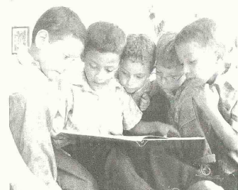
Las experiencias de los establecimientos han sido de mucho rigor, fundamentadas, pertinentes y prácticas para hallar la mejor opción de evaluar a los estudiantes dentro de las instituciones educativas.

Se debe evitar el facilismo Otro de los temas que llamó la atención y fue ampliamente discutido durante el encuentro, fue el facilismo con que los estudiantes se promueven al siguiente grado escolar. La norma señala que el 95% de los estudiantes debe ser promovido, aun cuando existen otras corrientes donde lo que se promueve es el desarrollo pedagógico del niño. La discusión sobre evaluación apenas inicia, por ello de las experiencias realizadas serán seleccionadas dos experiencias que representarán al departamento en el Foro Regional el próximo 26 de agosto, donde competirán los proyectos de La de Cuatro Bocas, un corregimiento de Turbaco, denominada "El evento cotidiano en la práctica evaluativa y el Desarrollo de las Competencias Textuales", que ocupó el primer lugar en este Foro y en el segundo puesto la del municipio de Manaí, denominada "La evaluación, eje transformador de la calidad educativa".