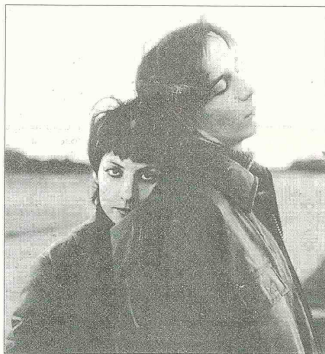
ESTA NOCHE LOS SAMARIOS podrán apreciar la cinta "Los Amantes del Círculo Polar" en el Museo Etnográfico.

ARTE, MODA Y SENTIDO SOCIAL. La unión entre los artistas colombianos y la industria de los electrodomésticos ha dado como resultado una campaña que beneficiará los programas desarrollados por la fundación "Mi Sangre" que creó y lide-