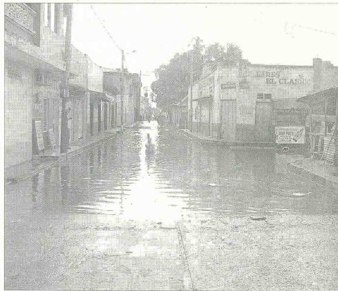
MUY PRONTO FUNDACIÓN contará con un servicio óptimo de alcantarillado que tendrá cobertura para 80 mil habitantes.

«Yo no voy a tapar el sol con las manos, frente a esta situación, no estoy muy contento con los indicadores mostrados y por ello creo que se deben hacer los ajustes en lo que tiene que ver con el funcionamiento de los hospitales, ya que quedó demostrado que la ejecución del semestre ha desbordado un poco el gasto en salud», afirmó.