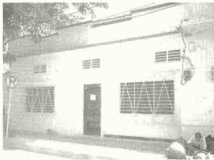
EL recaudo de los impuestos en Soledad, ha sido considerado poco significativo en cuanto al incremento del mismo en los últimos años.