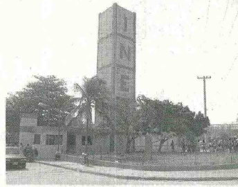
EN el colegio Inem se desarrollará la jornada de trámite de libretas militares para los bachilleres soledenses que aún no han resuelto su situación militar.