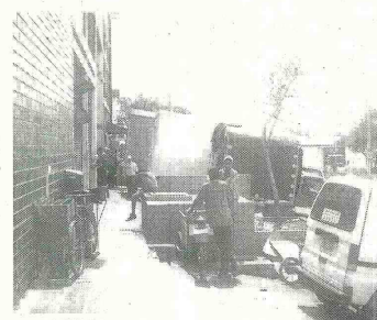
EN muchos sectores de Soledad se presentan casos de invasión del espacio público. En la gráfica, un andén por el que no se puede transitar debido a dicha invasión.