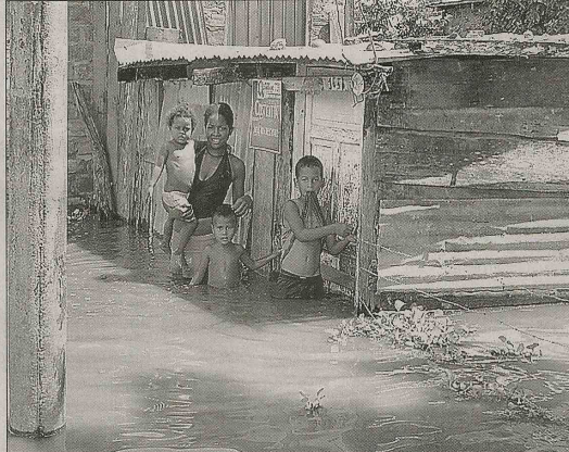
LA TEMPORADA invernal anterior dejó resultados devastadores en el municipio de Tenerife, con un amplio número de damnificados.