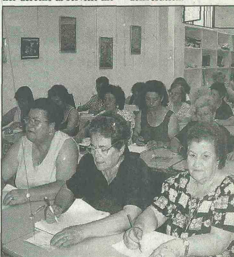
EN LA ACTUALIDAD se busca incluir un completo proyecto de apoyo a la educación para adultos.

Todas las propuestas consignadas en el Plan Decenal se está sistematizando para elaborar un documento que registre las visiones y que permita a los asistentes de la Asamblea Nacional de la Educación, contar con los insumos necesarios para la deliberación.