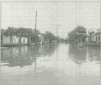
LAS INUNDACIONES que anualmente se presentan como consecuencia del desbordamiento del río, serán solucionadas definitivamente con la construcción de un muro de contención en el municipio de Tenerife.